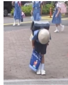
今の附属小の門礼