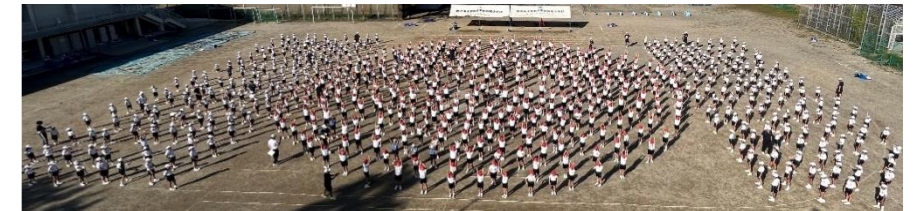
【約60年の伝統を誇る全校マスゲーム「のぞみの子」】

競技や種目においては、仲間と協力しながら粘り強く自分の役割を果たしたり、転んでしまっても最後まで全力で走り、バトンをつないだりするといった目標に向かって挑戦する姿が見られました。また、応援合戦においては、応援団長を中心に熱のこもった全力の応援が繰り広げられ、運動会を盛り上げてくれました。さらに、係児童の機敏な動作や各学年の集団行動は、練習の成果が発揮され、繊細かつ大胆さを感じさせてくれる姿でした。