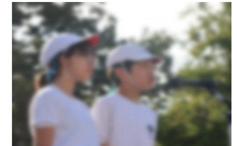
【主体性を発揮した運動会実行委員】

27日(日)に開催された今年度の運動会。「つなげよう！伝統のバトン みんなで協力 一人一人が輝く運動会」のスローガンの下、運動会実行委員会が中心となって運動会への士気を高めたり、当日の運営に参画したりする姿がありました。プログラムには記載されていなかった実習生と教職員のリレーをサプライズ企画するなど、これまで引き継いできた伝統と新たな企画が融合するといった子どもたちの主体性が発揮された運動会となりました。