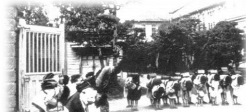
昔の附属小の門礼

本年度、附属小を「学びと育ちのステージ」と謳った。ステージとはまさしく「場」という意味で使っている。附属小というステージで繰り広げられる「学び」も「育ち」も子どもたちの人生にとってかけがえのないものになればと願う。また、彼らを取り巻く我々大人、一人一人の人生というステージについてもお互いに思いを馳せ、敬意をもって接したいものである。